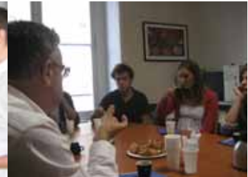
Petits-déjeuners - Rencontres de professionnels

→ Conduire des projets internationaux de A à Z