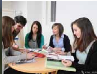
Réalisation de projets réels