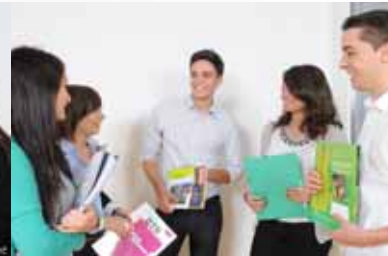
Participation à l'organisation d'évènements